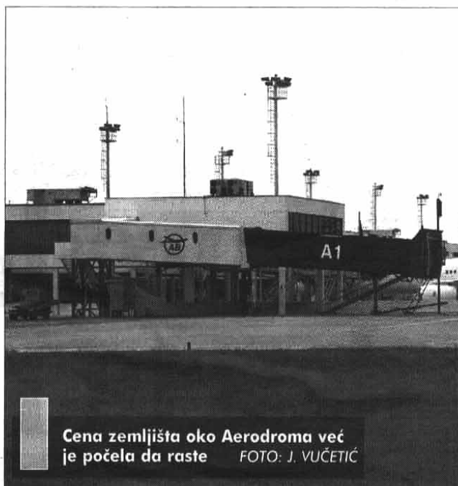
Cena zemljišta oko Aerodroma već je počela da raste

- Kad su investitori pre pet-šest godina dolazili u Beograd, nismo imali problem sa zemljištem. Međutim, poslednje tri-četiri godine pokazalo se da zemljišta nema dovoljno, pa smo počeli da radimo detaljne urabanističke planove da bi došli do zemljišta i lokacija. Trenutno je u izradi čak 120 planova, od kojih su tri najveća: plan za 500 hektara zemljišta na Adi-Huji, plan za Savski amfiteatar i plan privredne zone uz Autoput, koji bi trebalo da postane